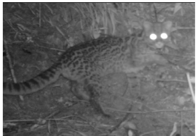
Las trampas cámara ofrecen fotos de otras especies a parte de las objetivo, y esto indica la biodiversidad en las propiedades participantes. La ilustración muestra un tiguillo chico manchado, una especie antes desconocida en el Nudo del Azuay.