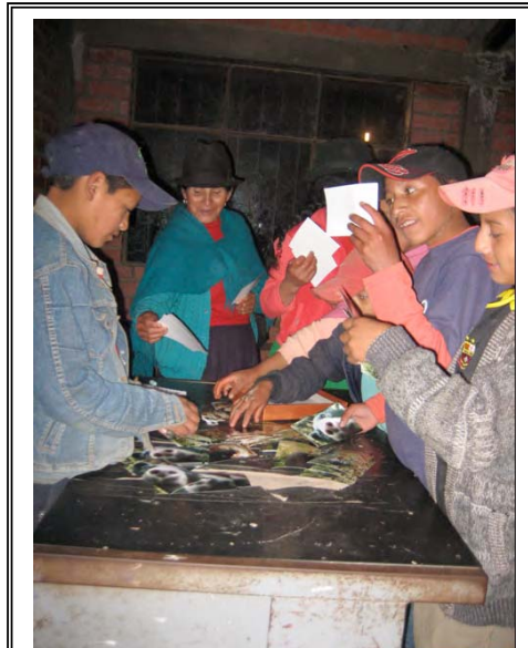
Miembros de la comunidad examinan fotos tomadas por una trampa cámara sobre la fauna presente en su propiedad.

consumidores y los mercados ganan confianza en que los pagos por incentivos son inversiones que valen la pena.