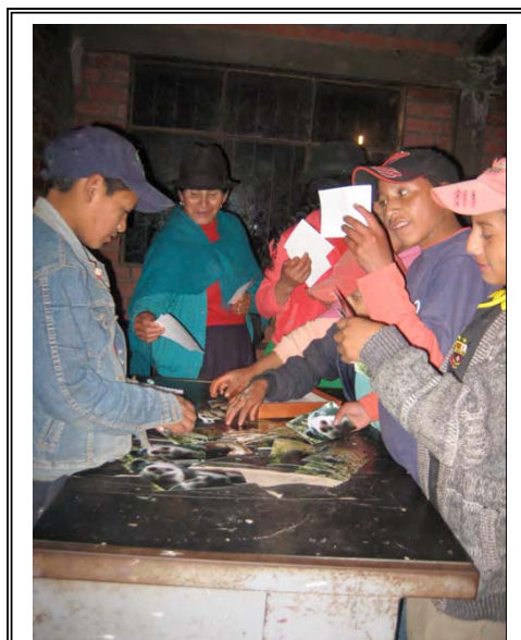
Miembros de la comunidad examinan fotos tomadas por una trampa cámara sobre la fauna presente en su propiedad.

identificación de individuos varias veces a través del tiempo, los donantes, los